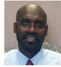
Laga soo bilaabo Isuduwaha Wacyigelinta SAYFSM Fikru Eticha