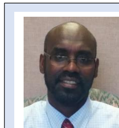
Laga soo bilaabo Isuduwaha Wacyigelinta SAYFSM Fikru Eticha

Feyraska keena cudurka AIDS kuma faafo taabashada, candhuufta, ilmada, hindhisada, qufaca, ama nooc kasta oo xiriir caadi ah. HIV wuxuu ku faafaa inta badan soo-gaadhista shahwada, dheecaanka xubinta taranka dumarka, dareeraha dabada, dhiiga, ama caanaha naaska qofka qaba HIV.