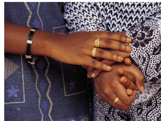
Virusi Vya Ukimwi haibagui!

Kujitunza ni njia muhimu ya kukusaidia kuishi maisha yenye afya bora na virusi vya ukimwi.