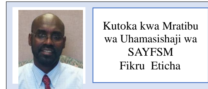
Kutoka kwa Mratibu wa Uhamasishaji wa SAYFSM Fikru Eticha

Virusi Vya Ukimwi huenezwa haswa kupitia mfiduo wa shahawa, giligili ya uke, giligili ya mkundu, damu, au maziwa ya mama kutoka kwa mtu ambaye ana Virusi Vya Ukimwi.