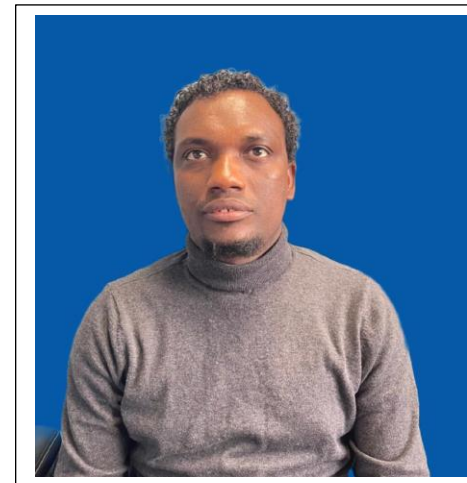
በባህር ዑመር የሚኒሶታ የኦሮሞ ማህበረሰብ ዋና ዳይሬክተር

“...የህብረተሰቡ ሰፊ ግንዛቤ ገና ከጫካ እንዳልወጣን ያሳያል”