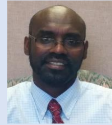
Qindeessaa Iddoo Lallabaa SAYFSM

Vaayirasiin AIDS fidu tuttuqqaadhaan, gororaan, imimmaaniin, haxxiffannaadhaan, qufaadhaan, ykn tuttuqqaa salphaa ta'e kamiin iyyuu hin faca'u. Vaayirasiin HIV harka caalmaadhaan kan inni daddarbu, karaa dhangala'aa qaama hormaata dhiiraa, dhangala'aa qaama hormaata dhalaa, dhangala'aa munnee, dhiiga, ykn aannan harmaa kan nama vaayirasiin HIV posatiiv ta'ee ti.