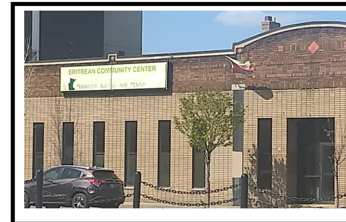
Kituo cha Jamii cha Eritrea cha Minnesota, Mtakatifu Paulo

Kituo cha Jamii cha Eritrea cha Minnesota (ECCM) kilianzishwa mwanzoni mwa miaka ya 1980. Ni shirika linaloundwa na Waeritrea kuwahudumia Waeritrea huko Minnesota.